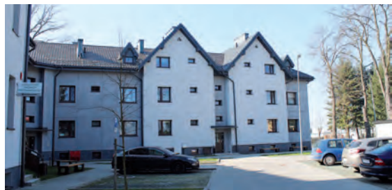
Przebudowa budynku komunalnego wraz z zagospodarowaniem terenu przy ulicy Głównej 122 w Kleszczowie

pokrycia panelami z blachy stalowej powlekaną na rąbek. Dokonano również napraw istniejących kominów poprzez uzupełnienie ubytków w spoinach i zabezpieczenie czap kominowych blachą. Wartość inwestycji: 500 tys. zł brutto.