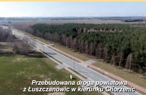
Przebudowana droga powiatowa z Łuszczanowic w kierunku Chorzenic