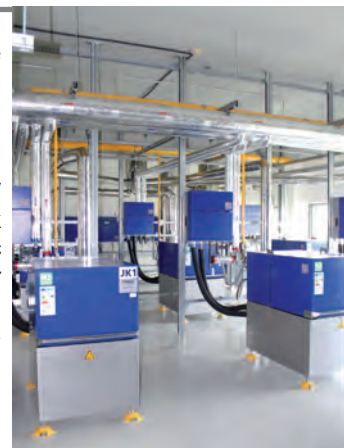
Budowa instalacji kogeneracji i PV na obiekcie Solpark Kleszczów

Modernizacja szkoły podstawowej w Kleszczowie, etap I – wymiana pokrycia dachowego z blachy trapezowej wraz z wymianą obróbek blacharskich, orywnowaniem, wymianą instalacji odgromowej oraz wymianą wyłazu dachowego z funkcją doświetlenia. Nowe pokrycie wykonano w systemie