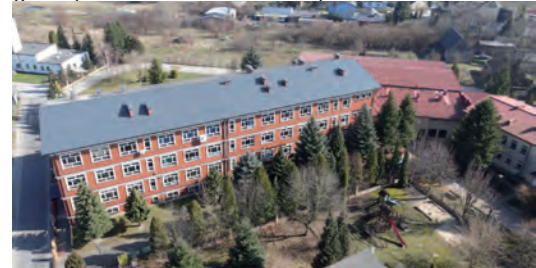
Modernizacja szkoły podstawowej w Kleszczowie, etap I - wymiana pokrycia dachowego

się liczbę budynków mieszkalnych oraz rosnącą liczbę mieszkańców gminy. Trwająca drugi rok pandemia COVID-19 nie pozostała bez