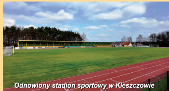
Odnowiony stadion sportowy w Kleszczowie