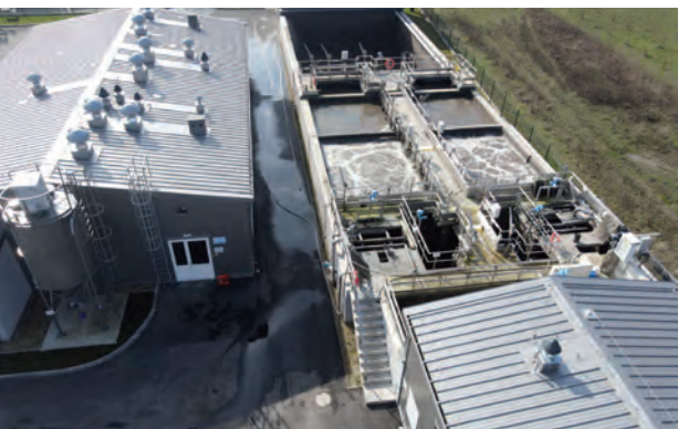
Rozbudowa oczyszczalni ścieków w Łękińsku

tów. Do tego montaż armatury łazienkowej, płytek ściennych i podłogowych, wentylatorów łazienkowych, drzwi wewnętrznych, ścianek systemowych. Została też wykonana in-