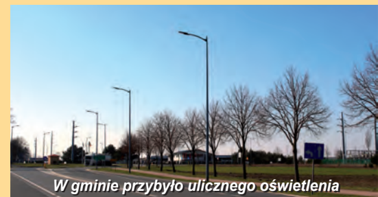
W gminie przybyło ulicznego oświetlenia