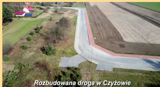
Rozbudowana droga w Czyżowie