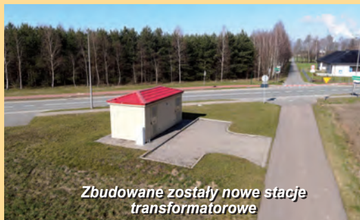
Zbudowane zostały nowe stacje transformatorowe