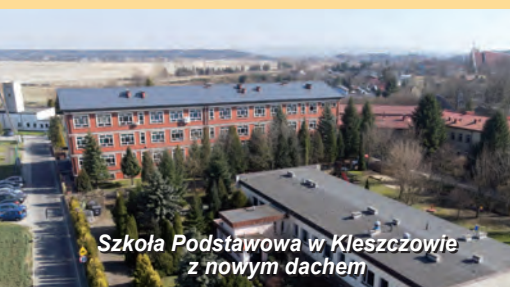
Szkoła Podstawowa w Kleszczowie z nowym dachem