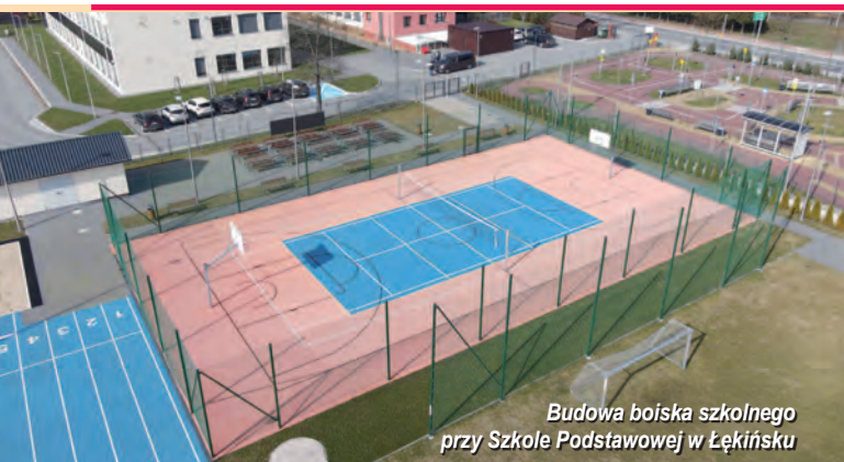
Budowa boiska szkolnego przy Szkole Podstawowej w Łękińsku