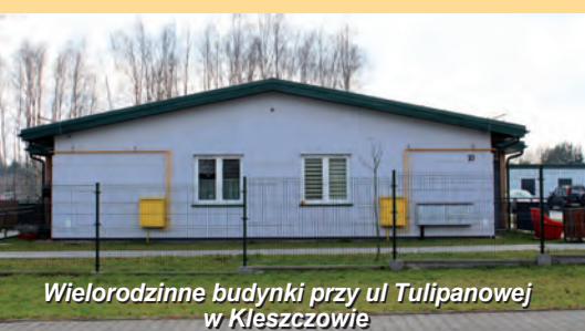
Wielorodzinne budynki przy ul Tulipanowej w Kleszczowie