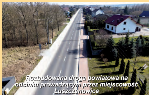
Rozbudowana droga powiatowa na odcinku prowadzącym przez miejscowość Łuszczanowice