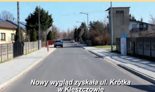
Nowy wygląd zyskała ul. Krótka w Kleszczowie