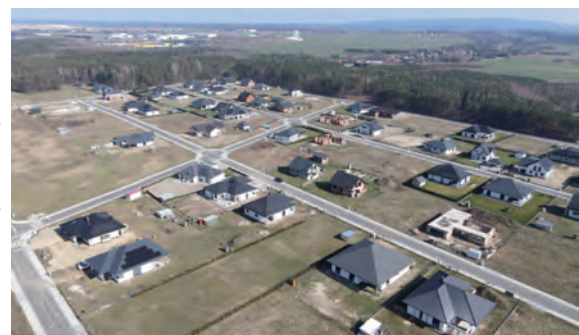
Budowa układu drogowego wraz z infrastrukturą techniczną, w tym budową gminnych sieci elektroenergetycznych, na osiedlu domów jednorodzinnych w Łuszczanowicach Kolonii

Budowa ścieżki rowerowej wzdłuż drogi powiatowej Łękińsko-Kamieńsk na odcinku od Czyżowa do granic Gminy Kleszczów. Wartość inwestycji: 1,84 mln zł brutto.