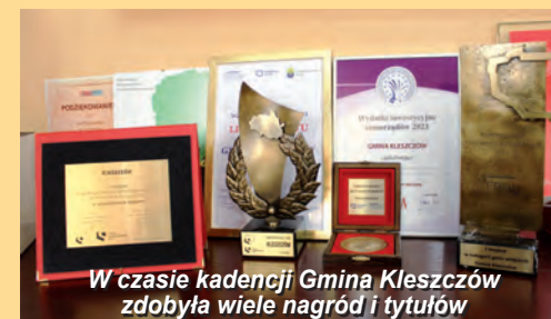
W czasie kadencji Gmina Kleszczów zdobyła wiele nagród i tytułów