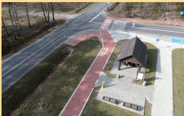
Budowa ścieżki rowerowej wzdłuż drogi powiatowej Łękińsko-Kamieński z miejscem obsługi dla rowerzystów

Modernizacja stadionu sportowego w Kleszczowie. Zakres inwestycji to: powstanie 400 metrowej bieżni lekkoatletycznej z czterema torami okrężnymi i sześcioma torami na prostej sprinterskiej. Na stadionie jest skocznia do skoku wzwyż, dwutorowa skocznia do skoku w dal i trójskoku z rozbiegiem jednokierunkowym, dodatkowo rzutnia do pchnięcia kulą, rzutnia do rzutów oszczepem, rzutnia do rzutów dyskiem i młotem. Pełnowymiarowe boisko piłkarskie z nawierzchnią z trawy naturalnej i systemem automatycznego nawadniania, budynek magazynowy przeznaczony do przechowywania sprzętu, nowe