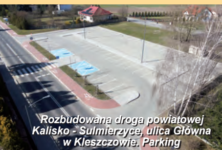
Rozbudowana droga powiatowej Kalisko - Sulmierzyce, ulica Główna w Kleszczowie. Parking