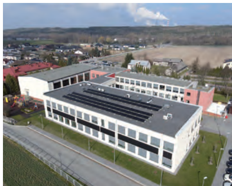
Rozbudowa budynku szkoły podstawowej w Łękińsku

Rozbudowa drogi powiatowej Kleszczów - Brudzice, ulica Ogrodowa w Kleszczowie wraz z rozbudową infrastruktury technicznej i wykonaniem kablowej sieci energetycznej. Wartość inwestycji: 2,9 mln zł brutto.