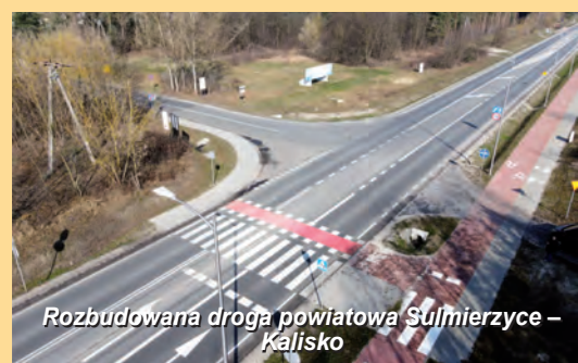
Rozbudowana droga powiatowa Sulmierzyce - Kalisko