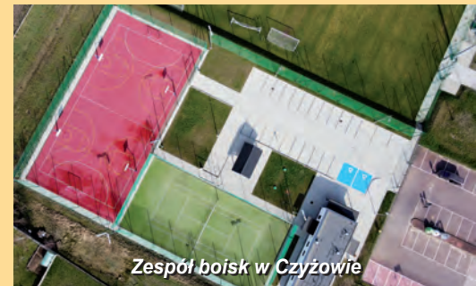
Zespół boisk w Czyżowie