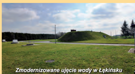
Zmodernizowane ujęcie wody w Łękińsku