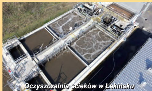
Oczyszczalnia ścieków w Łękińsku