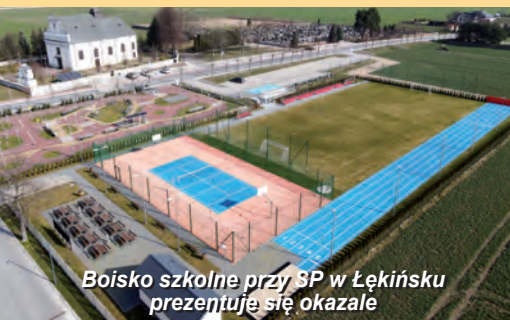
Boisko szkolne przy SP w Łękińsku prezentuje się okazale