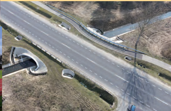
Naprawa drogi gminnej – obwodnica Kleszczowa- w rejonie kanału odwadniającego

W roku 2019 wydatki majątkowe budżetu gminy wyniosły około 74 mln zł . Jednym z obszarów, któremu samorząd gminy Kleszczów poświęcał najwięcej uwagi, była budowa i przebudowa gminnych oraz powiatowych dróg, połączona z modernizacją podziemnych sieci. Kolejnym obszarem, któremu samorząd gminy Kleszczów poświęcał najwięcej uwaga