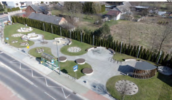
Modernizacja parku w Łuszczanowicach

Budowa dwóch budynków wielorodzinnych i budynku gospodarczego w Kleszczowie przy ulicy Tulipanowej. W zakres tego zadania wchodziła przede wszystkim budowa 2 budynków mieszkalnych wielorodzinnych