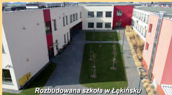
Rozbudowana szkoła w Łękińsku