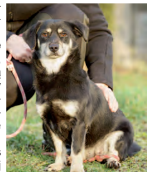
Bogusia czeka na kochającego dom

Zachęcamy także do adopcji psów ze schroniska w Bełchatowie. Bezdomne psy, wylapywane na terenie gminy Kleszczów trafiają do schroniska dla zwierząt w Bełchatowie, przy ul. Dzieszulickiej. Tu przechodzą okres kwarantanny, po którym mogą trafić do nowych właścicieli. Jest wiele powodów, dla których ludzie decydują się zaadoptować psa ze schroniska. Większość kieruje się sercem, wzdusza ich los cierpiących zwierząt, chcą pomóc przynajmniej jednemu z nich, przygarniając życiowego rozbitka pod swój dach. Każdy z mieszkańców gminy może wybrać w schronisku psa dowolnej maści, wieku i rasy, zapewniając mu szczęśliwy dom. Czworonożny pupil odwdzięczy się bezwarunkową przyjaźnią na całe życie. Wszystkie psy przebywające w bełchatowskim schronisku posiadają mikroczipy oraz aktualne szczepienia, są zadbane i znajdują się pod stałą opieką weterynaryjną. Obecnie w schronisku na nowy, przyjazny dom i życzliwego właściciela czeka dużo psieków.