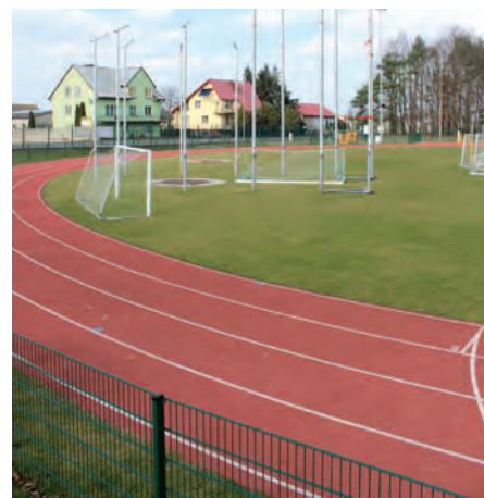
Modernizacja stadionu sportowego w Kleszczowie

pokrycia panelami z blachy stalowej powlekaną na rąbek. Dokonano również napraw istniejących kominów poprzez uzupełnienie ubytków w spoinach i zabezpieczenie czap kominowych blachą. Wartość inwestycji: 500 tys. zł brutto.