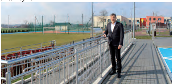
Budowa boiska szkolnego przy Szkole Podstawowej w Łękińsku

Rozbudowa drogi powiatowej 1500E na odcinku od ronda na Łękińsku do ronda w Czyżowie