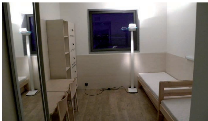
Typowy pokój w internacie

to 14,50 zł, za obiad - 21 zł, za kolację - 14,50 zł. Mieszkaniec internatu co miesiąc może zadeklarować, z których posiłków będzie korzystał.