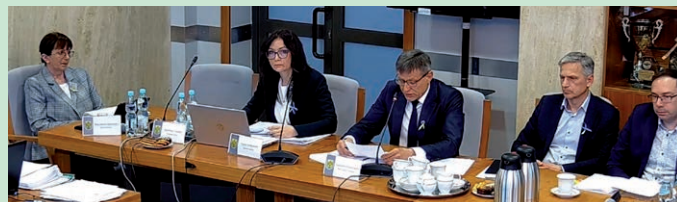
Na sesji w marcu wprowadzone zostały zmiany w programach gminnych

Punktem wyjścia do obniżek stawek i kwot gminnego wsparcia stała się wcześniejsza uchwała kierunkowa z 18 stycznia br., w której Rada Gminy Kleszczów zobowiązała wójta gminy „do podjęcia działań w celu obniżenia wydatków budżetu gminy Kleszczów”. W uzasadnieniu do każdej z tych kilkunastu uchwał podjętych w marcu, zostało przywołane sformułowanie, wyjaśniające iż kwoty dofinansowania ze środków budżetu Gminy Kleszczów ulegają zmniejszeniu z zachowaniem proporcji ubytku gminnych dochodów. Chodzi oczywiście o uszczerbek we wpływach z podatków, płaconych przez firmy ulokowane w obrębie geodezyjnym „Wola Grzymalina”, przeniesionym z początkiem 2022 roku decyzją rozbiorową Rady Ministrów RP do gminy Belchatów. Ubytek dochodów podatkowych z tego terenu oszacowany został na ok. 25 proc. w porównaniu z poprzednim budżetem gminy.