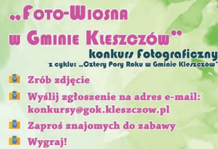
Fragment plakatu GOK, reklamującego konkurs

W konkursie mogą brać udział uczestnicy w wieku: • I kategoria: 12-17 lat, • II kategoria: 18+. Zwycięzca zostanie wyłoniony poprzez głosowanie w mediach społecznościowych GOK w Kleszczowie. Więcej szczegółów w regulaminie konkursu, który jest dostępny na stronie internetowej www.gok.kleszczow.pl .