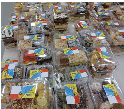
Tak prezentowały się ciasta przygotowane do sprzedaży

• Przedszkole w Kleszczowie jedną ze zbiórek przeprowadziło w połowie marca. Zgromadzone rzeczy (koce, śpiwory, ręczniki, środki higieniczne, żywność) przeznaczono dla uchodźców i mieszkańców Lwowa. Zbiórka podobnych artykułów prowadzona była też przez przedszkole w Łękińsku i miejscową jednostkę OSP.