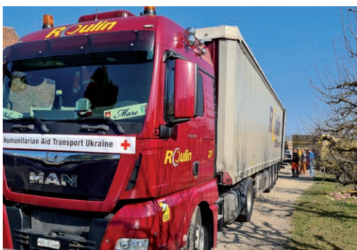
28 marca dotarł do Kleszczowa TIR z pomocą zebraną w Szwajcarii

• Kleszczów był obok Wrocławia jednym z dwóch miejsc, do których trafiły dary zbierane przez firmę DYNA ECO SOL w Szwajcarii. Były to m.in. artykuły medyczne, spożywcze higieniczne, koce i ubrania. Przywiezione do Kleszczowa dary zostały przekazane również na potrzeby uchodźców do Radomska, Bełchatowa i Piotrkowa Tryb.