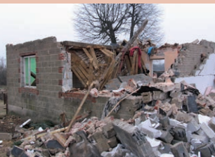
Jeden z domów w Dębnie w trakcie wyburzenia