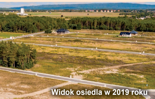
Widok osiedla w 2019 roku

W kwietniu w trzech przetargach nieograniczonych gmina zaoferuje nabywcom zakup 26 działek budowlanych pod domy jednorodzinne na coraz intensywniej zabudowywanym osiedlu w Łuszczanowicach Kolonii. Działki mają od 0,12 do 0,18 ha powierzchni, przy czym większość liczy po 12-15 arów. Ceny wywoławcze najmniejszych, 12-arowych parceli zaczynają się od 72.300 zł.