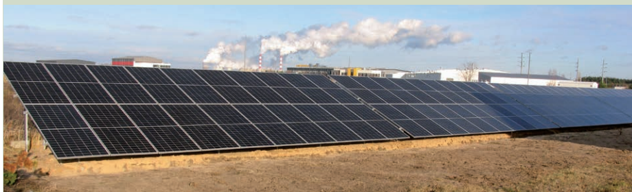
Projekt fotowoltaiczny na terenie firmy ENTRO w Żłobnicy uzyskał gminną dotację w 2021 roku

Każdy zrealizowany projekt, dzięki któremu uruchamiane są nowe pompy ciepła, zestawy ogniw fotowoltaicznych bądź urządzenia odzyskujące ciepło z systemu wentylacji, a w miejsce starego „kopciucha” montowany jest gazowy kocioł nowej generacji, oznacza mniej szkodliwych pyłów i gazów, trafiających do atmosfery oraz niższe koszty energii, jakie ponosi właściciel budynku.