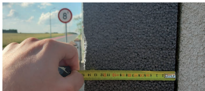
Taka warstwa styropianu pozwala zaoszczędzić dużo energii potrzebnej do ogrzewania

Dotfinansowanie uzyskali właściciele 36 domów: 10 z Kleszczowa, 8 z Łękińskiego, 6 z Łuszczanowic, 5 z Łuszczanowic Kolonii, 4 z Wolicy oraz 3 ze Żłobnicy.