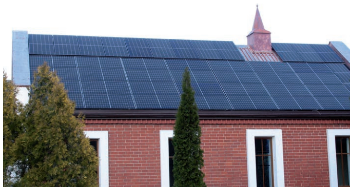
Energię elektryczną z dotowanych przez gminę paneli PV pozyskuje od niedawna także Parafia Ewangelicko-Reformowana w Kleszczowie

W ubiegłym roku gmina nie przyznała dotacji do trzech typów urządzeń, które są uwzględniane w programie dotacji. Chodzi o kolektory słoneczne, pompy ciepła służące do ogrzewania wody oraz kotły grzewcze na pelet. W roku 2021 bądź nie było chętnych na zakup tych urządzeń, bądź też zamierzonego montażu nie udało się zrealizować.