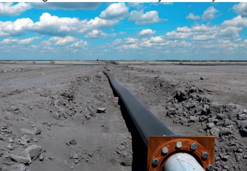
Hydrotransport popiołów na składowisku Elektrowni Bełchatów.