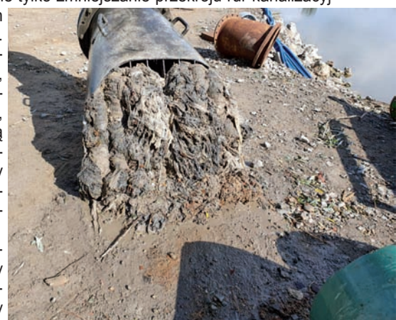
Tak wyglądały zdemontowane kosze ssawne pomp, które tłoczyły ścieki do oczyszczalni „Czajka”