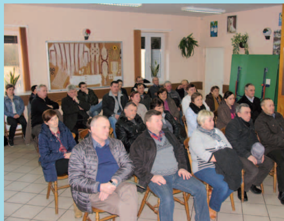
Zebranie z udziałem mieszkańców Czyżowa odbyło się 13 lutego

Jak zostały zrealizowane wnioski mieszkańców, zgłoszone na zebraniach w 2013 roku? Jakie zadania inwestycyjne zaplanowała gmina do wykonania w danym sołectwie? To dwa najważniejsze tematy omawiane podczas trwających właśnie zebrania wiejskich.