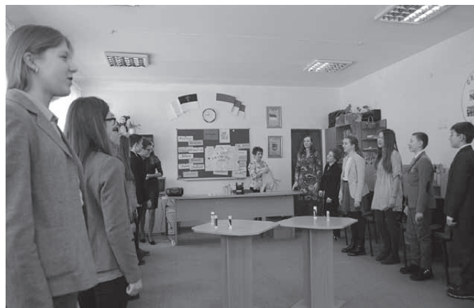
Program w wykonaniu uczniów

angielskiego, prowadzone w szóstej klasie przez trzech nauczycieli. W tej szkole uczniowie mają po osiem lekcji angielskiego tygodniowo. Angielski jest tu językiem wykładowym także dla innych przedmiotów. Każda lekcja rozpoczyna się odśpiewaniem hymnu Ukrainy, a ponieważ szkoła działa w formule chrześcijańskiej, są tu też zajęcia, podczas których rozważa się fragmenty Biblii.