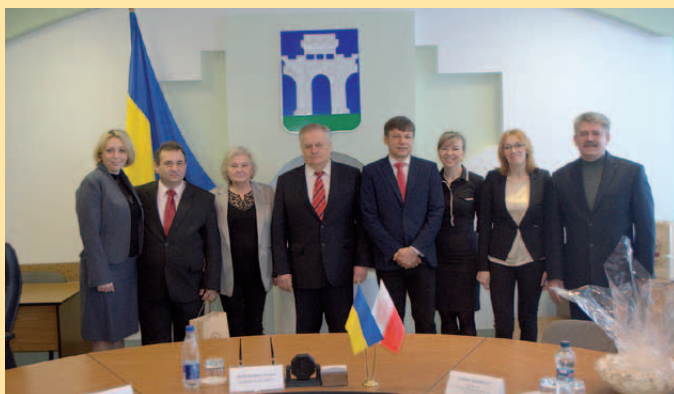
Pamiątkowe zdjęcie uczestników wizyty

miejscowości jedenastoklasową szkołę. Widać duże różnice w warunkach funkcjonowania szkoły w mieście i szkoły na wsi. Gdybym