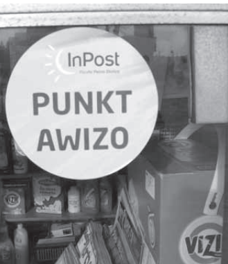
Tak oznaczane są punkty PGP

J ak wiadomo od początku tego roku dostarczaniem listów wysyłanych przez sądy i prokuratury zajmuje się nowa firma - Polska Grupa Poczтовая. Wygrała ona przetarg na doręczanie sądowych i prokuratorskich przesyłek. Zaoferowała niższą cenę usługi niż Poczta Polska.