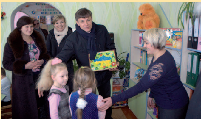
Satiw - wizyta w przedszkolu

chciał w jednym zdaniu podsumować wrażenia z tego wyjazdu to powiem tak: byliśmy zaskoczeni i wzruszeni gościnną Ukrainców.