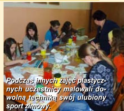
Podczas innych zajęć plastycznych uczestnicy malowali dowolną techniką swój ulubiony sport zimowy.

Filia GBP w Żłobnicy zorganizowała warsztaty decoupage , których uczestnicy zdobili przedmioty techniką serwetkową. Dzięki temu wzory na wszystkich pracach wyglądały jak namalowane.