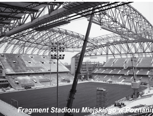
Fragment Stadionu Miejskiego w Poznaniu

Jeden z najnowszych to Stadion Miejski w Poznaniu – otwarty już obiekt na ponad 41 tys. miejsc. W drugiej połowie roku 2009 firma Kersten Europe wykonała dla Poznania gięcie rur stalowych o średnicy od 114,3 mm do 355,6 mm oraz dwuteowników typu HEA240 o łącznej wadze ok. 500 ton. Te elementy posłużyły do zmontowania konstrukcji zadaszenia.