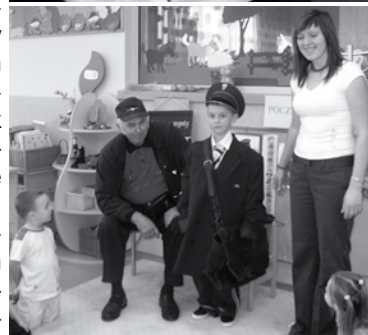
Dzieci już podczas przedszkolnych zajęć poznają przedstawicieli różnych zawodów