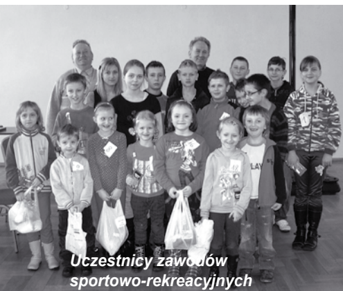
Uczestnicy zawodów sportowo-rekreacyjnych

W dniach 20 i 27 stycznia w siedzibie klubu Omega Kleszczów odbyły się zawody sportowo-rekreacyjne dla młodzieży szkół podstawowych, gimnazjalnych i ponadgimnazjalnych. Rozegrano m.in. konkurencje: rzut łotką, rzut do kosza, przeciąganie liny, warcaby, rzut ringo, rzut piłeczką palantową do celu.