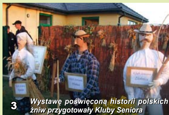
3 Wystawę poświęconą historii polskich żniw przygotowały Kluby Seniora