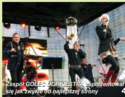
4 Zespół GOLEC ORKIESTRA zaprezentował się jak zwykle od najlepszej strony