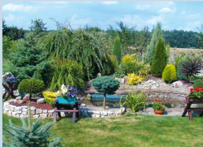
Fragment posesji, nagrodzonej I nagrodą

Wyniki konkursu ogłoszone zostały w trakcie Dożynek Gminnych 2010. Kolejna edycja już za rok.