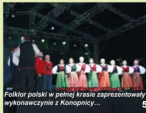
5 Folklor polski w pełnej krasie zaprezentowały wykonawczynie z Konopnicy...