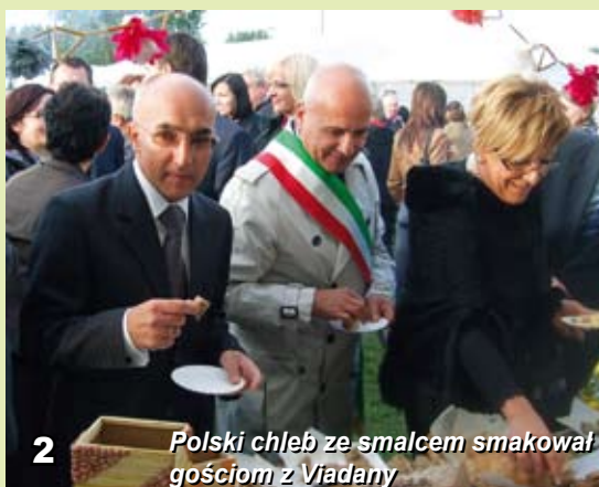
2 Polski chleb ze smalcem smakował gościom z Viadany