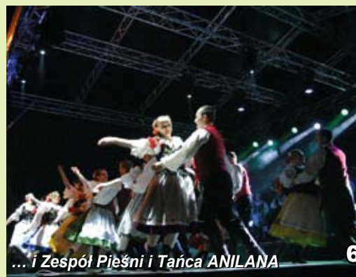
6 ... i Zespół Pieśni i Tańca ANILANA