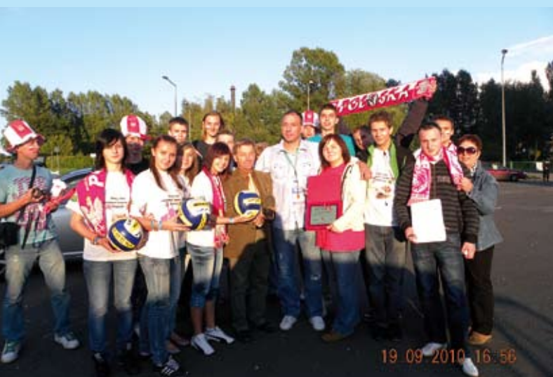
Kleszczowscy wolontariusze kibicowali siatkarkom, a przede wszystkim idei „Podaruj innym część siebie”.